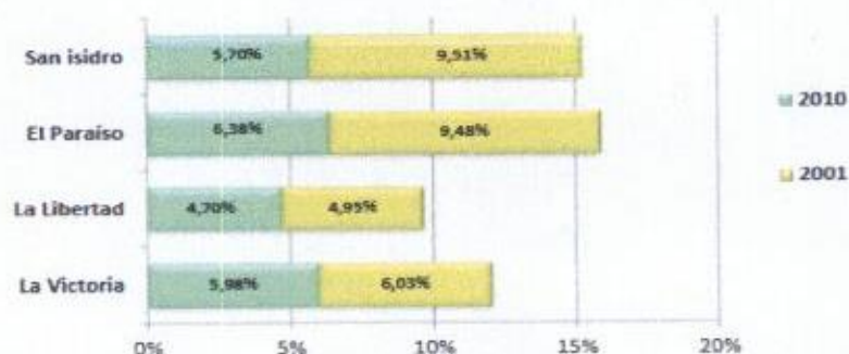
Gráfico de Tasa de Analfabetismo – Las Lajas